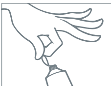
Rimuovere la linguetta di sicurezza