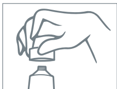
Svitare il tappo del tubetto