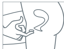
Applicare il gel nell'area genitale esterna